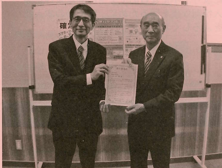
青色コーナー協力要請状伝達式 令和6年1月18日

さる、1月18日の青色コーナー従事者研修会において、令和5年分確定申告期に、板橋税務署が相談会場に設置する「青色コーナー」への従事依頼として、板橋税務署の高橋署長から大戸会長へ「協力要請状」の交付が行われました。