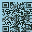
主税局HP (縦覧について)