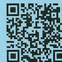
主税局HP (本人確認方法について)